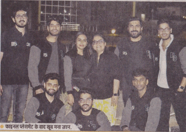
● फाइनल प्लेसमेंट के बाद खूब मना जश्न.

इस बार कैंपस में 155 से अधिक कंपनियां प्लेसमेंट के लिए पहुंचीं। इस बार चालीस फीसदी स्टूडेंट्स केवल सेल्स और एचआर से विभिन्न कंपनियों में रिक्रूट हुए हैं।