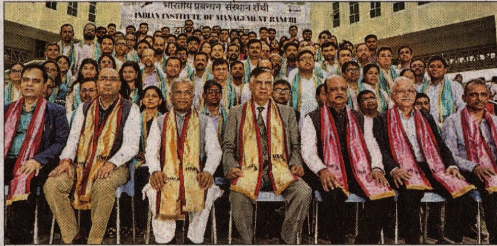
प्रबंध नगर, नया सराय रोड स्थित स्वामी विवेकानंद सभागार में शनिवार को भारतीय प्रबंधन संस्थान, रांची के 12वें दीक्षांत समारोह में मुख्य अतिथि राज्यसभा के उपसभापति हरिवंश के साथ डिग्री प्राप्त करने वाले विद्यार्थी और अतिथि।