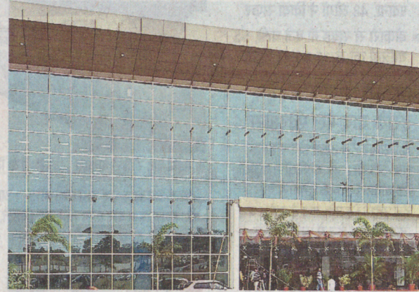
भव्य है भवन : आइआइएम रांची का न्यू सेमिनार हॉल • जागरण

से 13.56 करोड़ रुपये की लागत से निर्मित 40,000 वर्ग फीट में फैले हुए इस ऑडिटोरियम की क्षमता 650